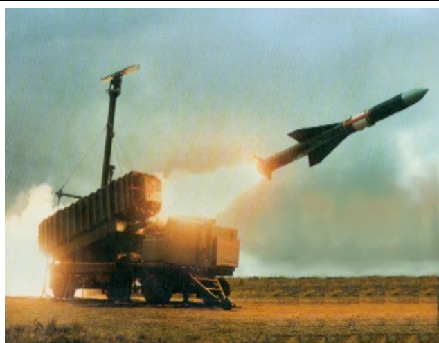
Batería de Misiles Excalibur