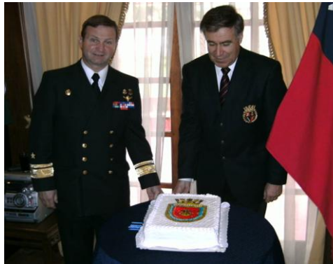
CELEBRANDO EL ANIVERSARIO

Se efectuó, en ceremonia presidida por el Sr. Comandante General del Cuerpo IM, el día sábado 15 de Junio en nuestra sede con asistencia de numerosos Legionarios IM una delegación de Oficiales IM en servicio activo especialmente invitada. Se recibió también a los nuevos Legionarios IM.