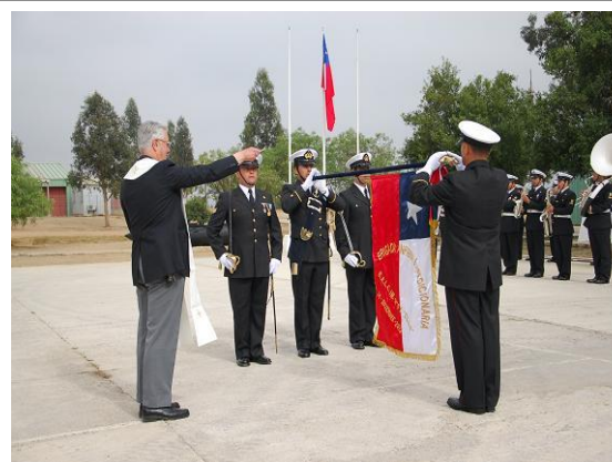
BENDICION DEL ESTANDARTE