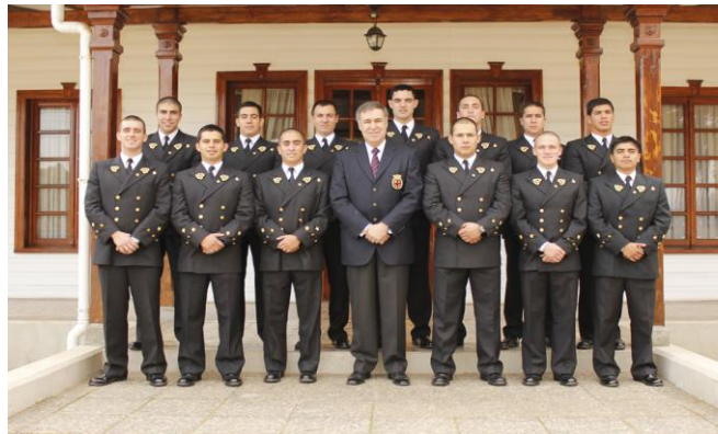
NUEVOS LEGIONARIOS IM