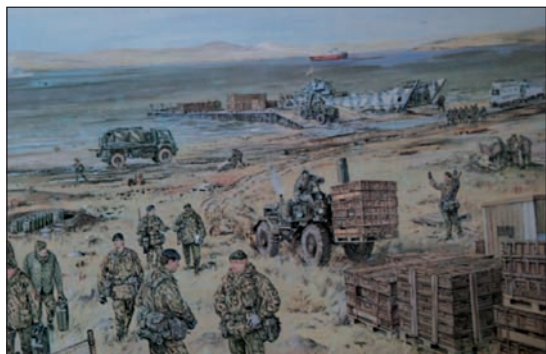
Alegoría al Desembarco en la bahía San Carlos, en islas Falkland.

Por aquellos años, nuestra Infantería de Marina venía desarrollando estudios para emplear los principios de la guerra de maniobra en las operaciones anfibias. Sus conclusiones, que coincidían con los resultados logrados por los británicos en Malvinas, inspiraron la evolución del pensamiento y los procedimientos anfibios. Pero, como pareciera lógico, fue en los Estados Unidos donde debía registrarse el cambio decisivo que permitió sacar a la guerra anfibia de la crisis en la que había estado sumida durante un decenio. El US Marine Corps confeccionó un modelo teórico sobre el asalto anfibio en el teatro europeo, que se orientaba a una penetración en fuerza desde la mar, en un ambiente de alta intensidad de combate. El cambio surgido en el escenario internacional a partir de 1989 hallaría pues, al concepto de guerra anfibia en un insuperable “estado de salud”. Es entonces cuando la US. Navy cambió sus ideas sobre estrategia marítima, para adoptar el innovador, pero cuestionado concepto “From the Sea”, el cual reformaba la clásica mentalidad de las fuerzas navales enfocadas sólo a los combates de “aguas azules” 9 o batallas en mar abierto, hacia uno orientado a las zonas de litoral. Desvanecido el peligro soviético, el predominio naval podía servir ahora, esencialmente, para proyectar poder desde